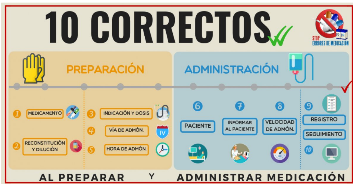
Figura 1. Preparación y administración de medicación: “10 correctos”.

CE 12: Establecer una relación empática y respetuosa con el paciente y familia, acorde con la situación de la persona, problema de salud y etapa de desarrollo.