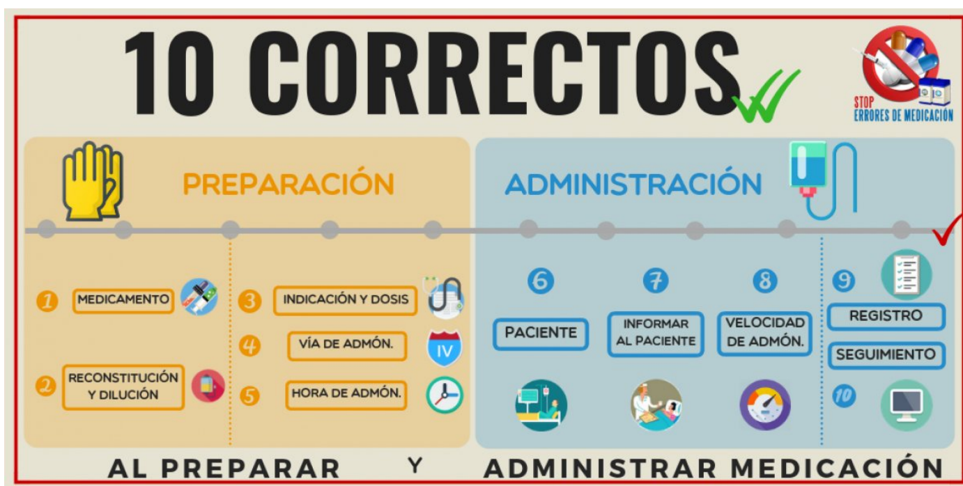
Figura 1. Preparación y administración de medicación: “10 correctos”.

CE 12: Establecer una relación empática y respetuosa con el paciente y familia, acorde con la situación de la persona, problema de salud y etapa de desarrollo.