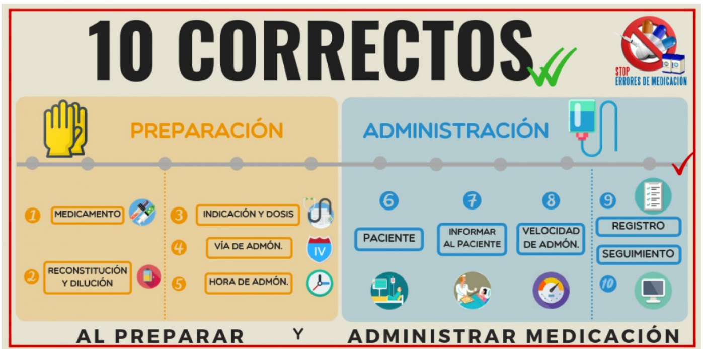
Figura 1. Preparación y administración de medicación: “10 correctos”.