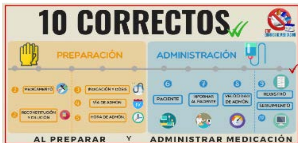
Figura 1. Preparación y administración de medicación: “10 correctos”.

CE 12: Establecer una relación empática y respetuosa con el paciente y familia, acorde con la situación de la persona, problema de salud y etapa de desarrollo.